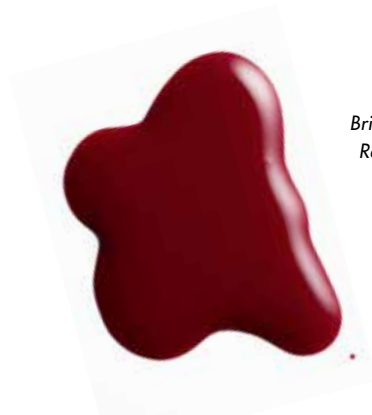
Brilliant Nail Red Allure

LIEBEVOLL GEPFLEGT UND SCHÖN BIS IN DIE FINGERSPITZEN.