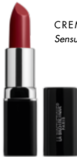
CREMIGE VERFÜHRUNG: Sensual Lipstick C148 Red.

PUSH-UP Marilyn hätte ihn geliebt! Der Instant Volumising Powder ist ein echter Zauberpuder. Kaum aufgestäubt, macht er sich im Haar komplett unsichtbar und sorgt doch für einen unübersehbaren Wow-Effekt. Seine Hightech-formel liftet jedes Haar am Ansatz, schafft traumhafte Fülle, ungezwungene Textur und lässt sich jederzeit nach Lust und Laune umstylen.